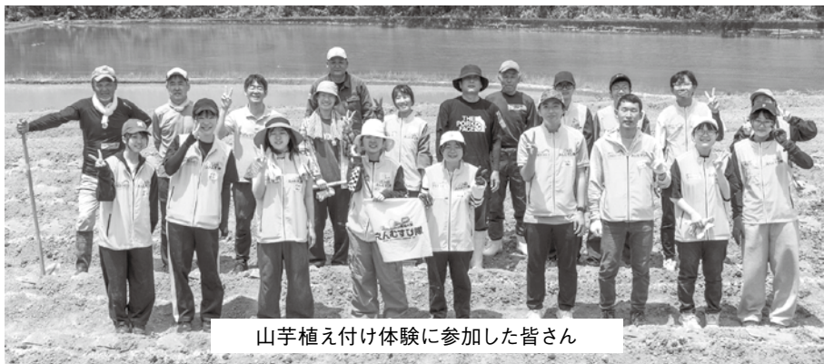
山芋植え付け体験に参加した皆さん