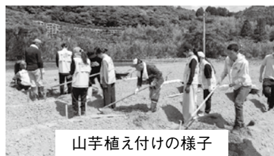
山芋植え付けの様子