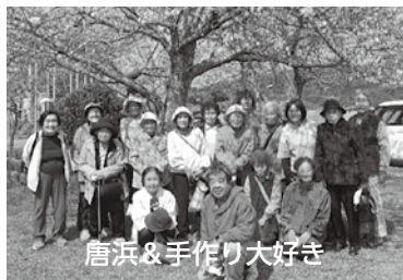
唐浜&手作り大好き